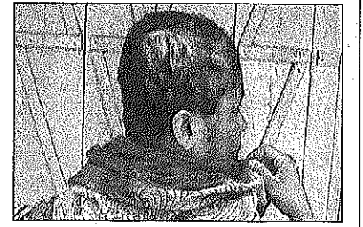
পুলিশ উদ্ধার করে নিয়ে আসার পর তেহেঁট খানায় নিখাতি।

নাকাশিপাড়া থানা এলাকার বাসিন্দা। ভিক্ষে করতেই তিনি শুক্রবার মালিয়াপোতা গ্রামে গিয়েছিলেন বলে